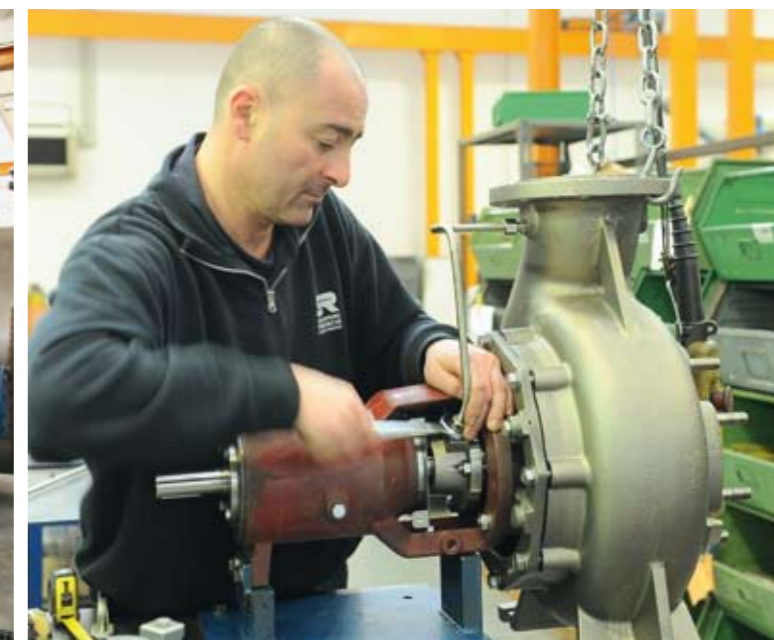
Pompa in montaggio