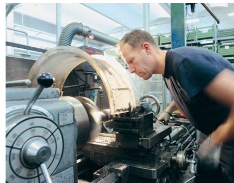
Lavorazione parti speciali a commessa